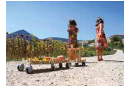
1º "Las niñas y el tren" José Luis De Andrés Hueso

que forman parte de la Mancomunidad. Al igual que el año pasado, se va a editar un calendario con las fotografías presentadas al certamen, que se buzonerá próximamente.