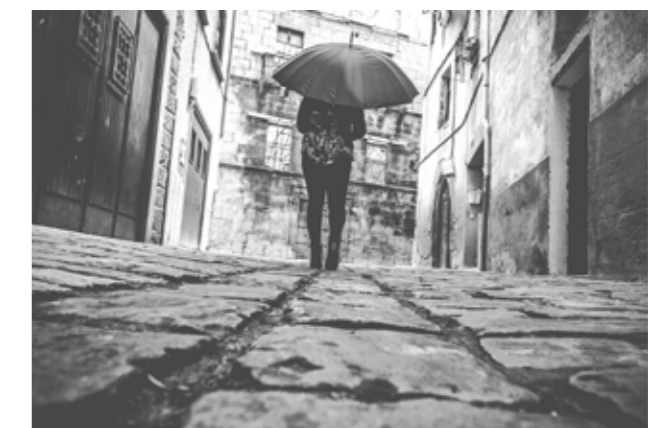
Premio Popular: "En Aoiz hay una calle adoquinada" Edurne Mañú Aristu