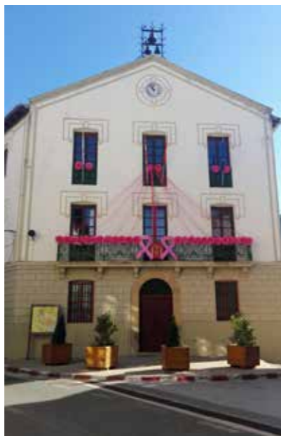
Lehiaketa honen helburua hau da: SARAYren alde erkidegoa arrosa

Urte guztian zehar ekintza eta jardunaldiak egiten dira, aurtengo “Nafarroa arrosazko SARAYren alde” deitu den bigarren lehiaketa izanik, eta herri-erakundeei, enpresei eta Nafarroako merkataritzari zuzendutakoa.